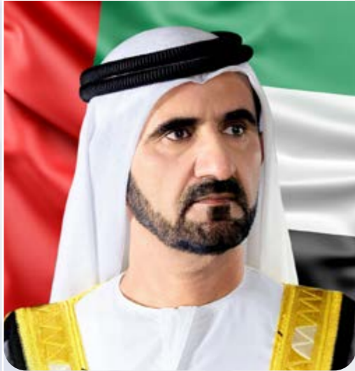
صاحب السمو الشيخ محمد بن راشد آل مكتوم نائب رئيس الدولة رئيس مجلس الوزراء حاكم دبي