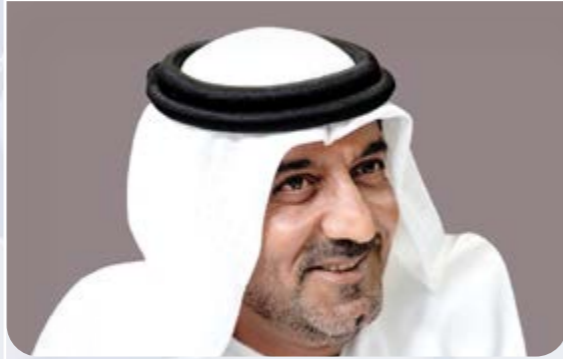
سمو الشيخ أحمد بن سعيد آل مكتوم رئيس مجلس الإدارة