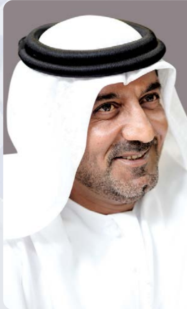
سمو الشيخ أحمد بن سعيد آل مكتوم رئيس مجلس الإدارة

بالنيابة عن مجلس الإدارة، يسعدني أن أضع بين أيدي مساهمينا وشركائنا الاستراتيجيين تقرير الحوكمة المؤسسية لبنك الإمارات دبي الوطني ش.م.ع ("بنك الإمارات دبي الوطني" أو "البنك") لعام 2022.