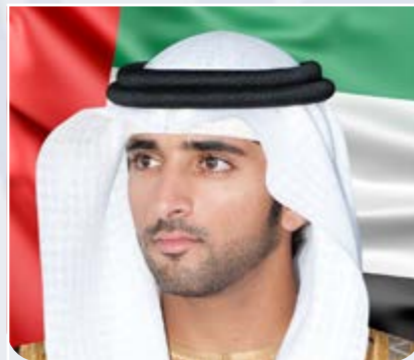
سمو الشيخ حمدان بن محمد بن راشد آل مكتوم ولي عهد دبي