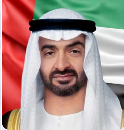
صاحب السمو الشيخ محمد بن زايد آل نهيان رئيس دولة الإمارات العربية المتحدة