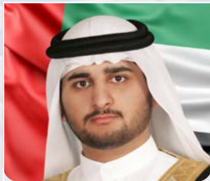
سمو الشيخ مكتوم بن محمد بن راشد آل مكتوم نائب حاكم دبي، نائب رئيس مجلس الوزراء وزير المالية لدولة الإمارات العربية المتحدة